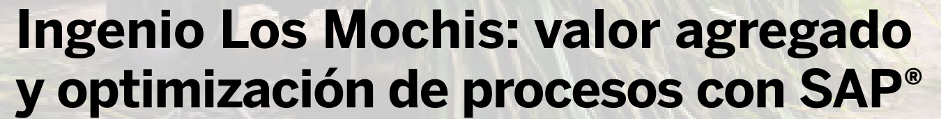
Foto | Compañía Azucarera de los Mochis, Sinaloa, México. Autorizada su utilización.